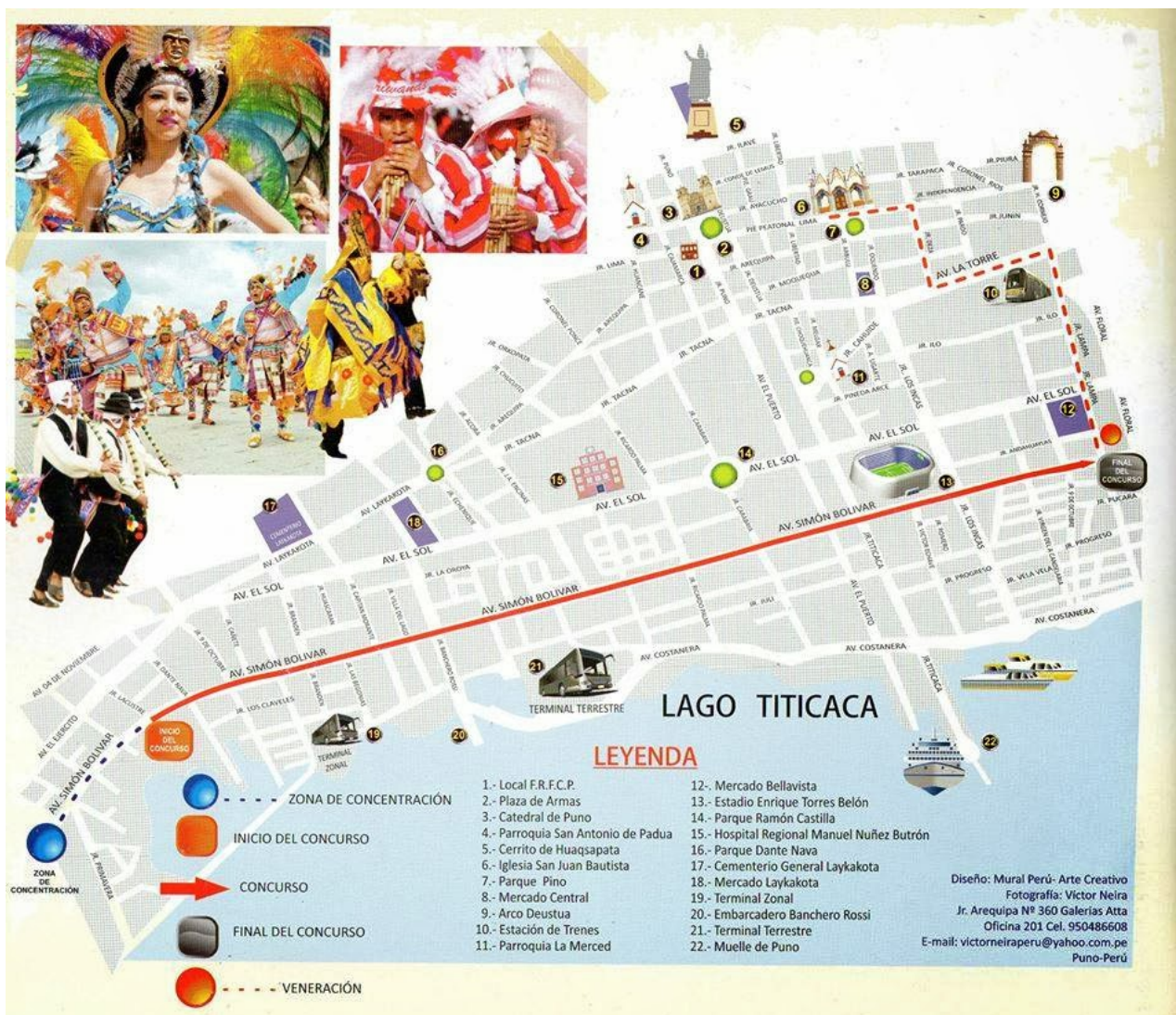
Figura 2. Croquis de la ruta de la Parada de Veneración del 2014.

No obstante, la FRFCP reafirmó que no se haría cargo por el último tramo recorrido, convocando a una asamblea extraordinaria donde los delegados ratificaron su posición de venerar a la virgen en la avenida cercana al lago, así mismo, se criticó la injerencia del Ministerio de Cultura en la organización de la festividad por haber solicitado una ratificación del tramo final de la “Parada de Veneración”. En una asamblea extraordinaria el presidente se refirió a la polémica: