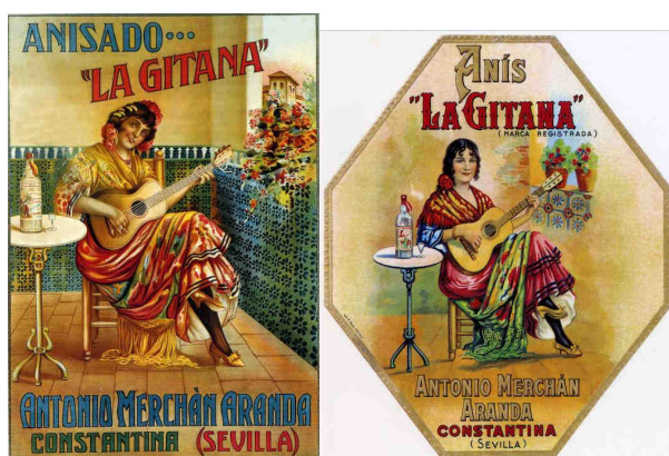
Ilustración 2: Publicidad del anís La Gitana (postales de Ediciones AM, Studio Editores S.L., procedentes de la Colección Carlos Velasco: nº 2941 'Anisado La Gitana', AM, 'Anís La Gitana', nº 779)

que, junto a una mesa donde campea una botella del licor publicitado y una copita, de cara al público tañe una guitarra de palillos en una síntesis esquemática pero suficiente de ambiente andalucista, en sus diversas variantes, hoy disponibles en pulcras postales dirigidas al turismo,