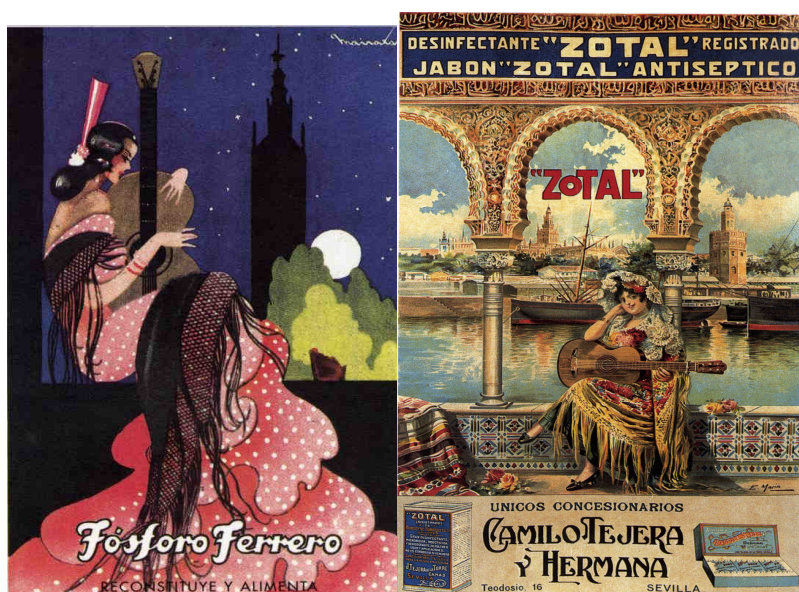
Ilustración 3: Publicidad de Fósforo Ferrero (Ediciones AM, Studio Editores S.L., nº 13) y de Zotal (Ediciones AM, Studio Editores S.L., nº 76)

aquella otra representación que anunciaba un medicamento, que con su clásica leyenda “Fósforo Ferrero. Reconstituye y alimenta”, muestra a una mujer con bata de cola y mantilla abrazando una guitarra que está sobre su regazo en posición totalmente vertical, sobre un paisaje característico en que se recortan la Giralda y la luna al fondo, o el célebre desinfectante Zotal, que también se sumó al estereotipo, justificado por la ubicación en Sevilla del único concesionario. La lista podría seguir por las etiquetas de distintos tipos de vino de Jerez y un largo etcétera.