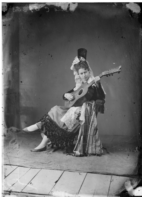
Ilustración 1: "Tipo español. Dama sevillana tocando la guitarra (tomada del natural)". Fotografía de E. Gateau / J. Laurent, 1878. Archivo Ruiz Vernacci, NIM. 17618 (el título se corresponde con la ficha realizada por Ruiz Vernacci). Fototeca del Instituto del Patrimonio Cultural de España (IPCE). Ministerio de Cultura.

La fotografía más antigua que conozco protagonizada por una tocaora , o más propiamente dicho, una mujer tocando una guitarra 2 , se conserva en el IPCE (Instituto del Patrimonio Cultural de España). Fue tomada en 1878 por E. Gateau/J. Laurent, dos conocidos fotógrafos franceses afincados en España, y dada a conocer recientemente, en una exposición realizada en 2008, comisariada por Carlos Teixidor ( Sevilla... 2008 : 94; también reprod. en Garrote Fernández-Díez 2009: 116).